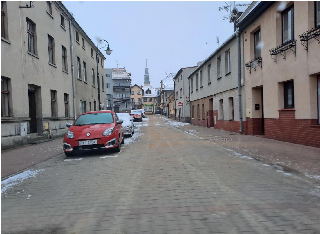
Aleja Powstańców Wielkopolskich